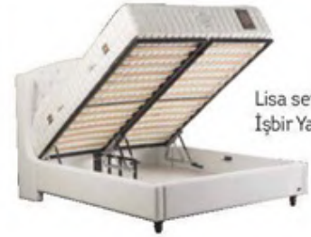
Lisa set: 4.280 TL., İşbir Yatak.