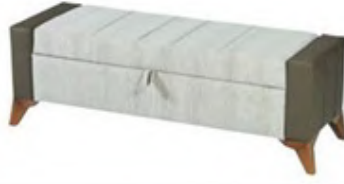
Pulsar puf: 632 TL, Armis.

Suzani gibi zamansız motifler içinde bulunduğu mekana sofistike bir görünüm eklemeyi başarır. Pufunuzla iç mekanlara şık detaylar katabilirsiniz.