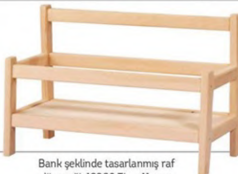
Bank şeklinde tasarlanmış raf düzeneği: 199,90 TL., nll.com