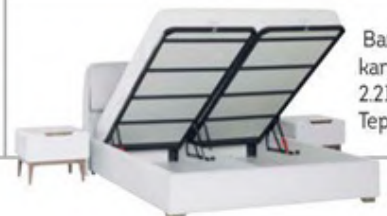
Bazalı karyola: 2.218 TL., Tepe Home.