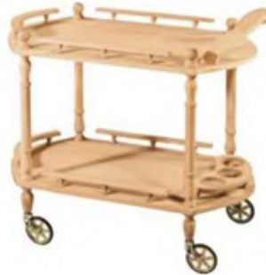
Masifart servis arabası: 725 TL, hepsiburada.com