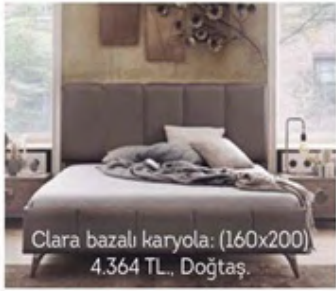
Clara bazalı karyola: (160x200) 4.364 TL., Doğtaş.

Bebek, çocuk ya da yatak odasındaki karyolalar; bu mekanların hemen hemen en çok yer kaplayan öğeleri. Karyolaların depolamalı olanlarını tercih etmeniz ise, sahip olduğunuz alanı fonksiyonel olarak değerlendirmenin en önemli sırlarından biri.