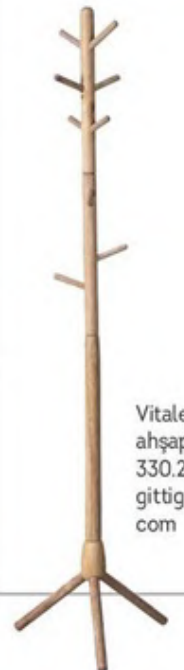
Vitale Gala ahşap askı: 330,20 TL., gittigidiyor.com

Çocukların küçüklüklerinden itibaren düzen alışkanlığı geliştirebilmesi için onların kolaylıkla erişebileceği yükseklikte sevimli tasarımlar bizce çok güzel.