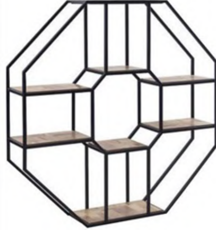
Metal raf, Tepe Home.