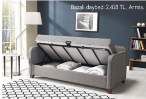
Bazalı daybed: 2.418 TL., Armis.