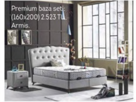
Premium baza seti: (160x200) 2.523 TL., Armis.