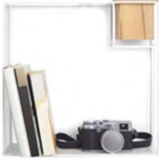
Umbrama marka mini raf: 35 TL., hipicon.com