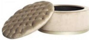
Kapitoneli puf: 1.945 TL, Tepe Home.