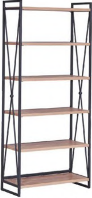
Tres açık raf ünitesi: 956 TL., Çetmen Mobilya.

İster modüler, ister duvarda olsun, her daim her şeyin elinizin altında olmasını sağlayan açık raf sistemleri ve ayaklı askılar sayesinde, düzeni de bir çırpıda sağlarsınız.