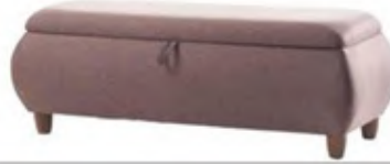
Pera sandıklı puf: 780 TL, İşbir Yatak.