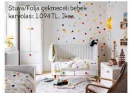
Stuva/Folja çekmeceli bebek karyolası: 1.094 TL., Ikea.