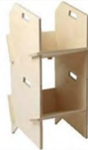
Daddy Mood ahşap raf: (adet) 545 TL., hipicon.com

Açık raf sistemi dediğimizde hemen aklınıza köşeli hatlar gelmesin; yuvarlak hatlara sahip raflar yaşam alanlarında da yumuşak bir geçiş yaratır.