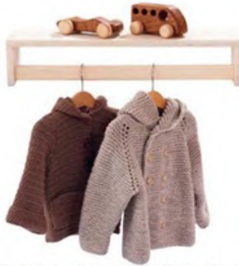
Masif ahşap duvar rafı: 45,90 TL., nll.com.