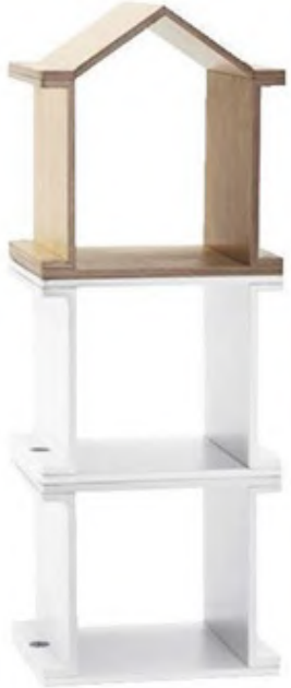
Lil'Gaea kule kitaplık: 1.238 TL., hipicon.com