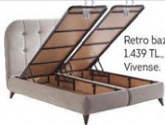
Retro baza: 1.439 TL., Vivense.