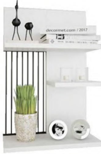
Kompakt duvara monte raf: 179 TL., Bauhaus.