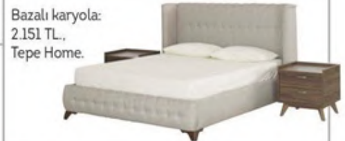
Bazalı karyola: 2.151 TL., Tepe Home.