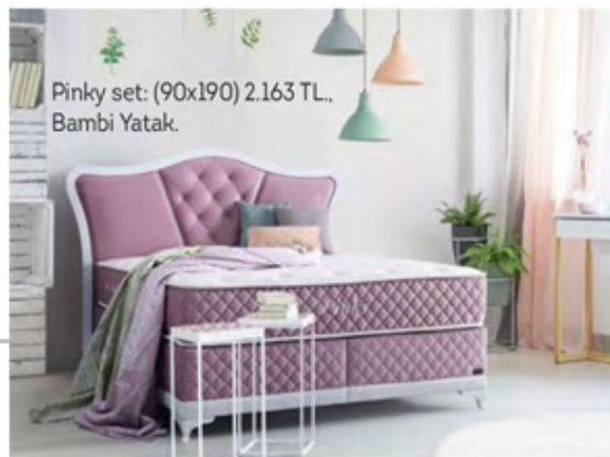
Pinky set: (90x190) 2.163 TL., Bambi Yatak.

OYUN ÇAĞINDAKİ ÇOCUKLAR İÇİN Oyuncakları nereye sığdırsam diye düşünüyorsanız özellikle bu yaş grubundaki çocuklar için altı çekmeceli karyolaları değerlendirebilirsiniz.