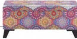
Mandala desenli sandıklı puf: 319 TL, armutminderim.com