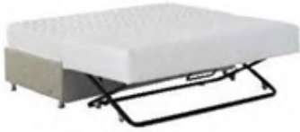
Yavrulu ve depolamalı baza: 1.488 TL., İşbir Yatak.