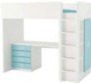
Stuva/Fritids karyola: 2.933 TL., Ikea.