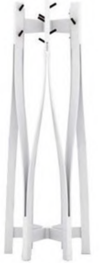
Rafevi Hexo askı: 918.65 TL., gittigidiyor.com