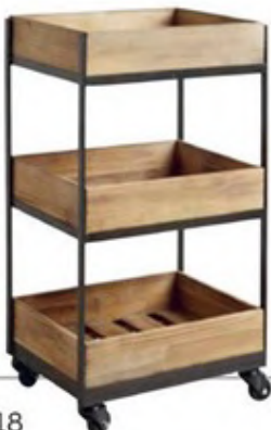
The Mia servis arabası: 599.99 TL, nll.com

Onlar artık bir servis sehpası olmanın çok ötesinde. Çiçeklik, sebzelik, banyo rafı, hobi malzemeleri düzenleyicisi gibi artık sayısız işlevi var.