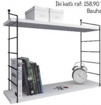
İki katlı raf: 158,90 TL., Bauhaus.