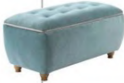
Su yeşili şönil puf: 324 TL, Çilek.