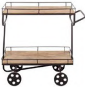
Rosie servis arabası: 1.393 TL, Mudo Concept.