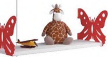
Kelebek raf destekli raf: 24,90 TL., gittigidiyor.com

Heykelsi görünümleriyle fark yaratan bu tarz askılar yalnızca fonksiyonel bir parça olmakla kalmıyor aynı zamanda çarpıcı bir köşe oluşturmanıza da yardımcı oluyor.