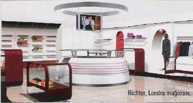
Richter, Londra mağazası.