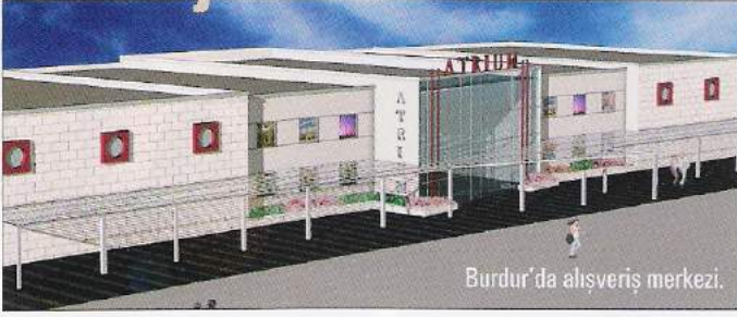
Burdur'da alışveriş merkezi.