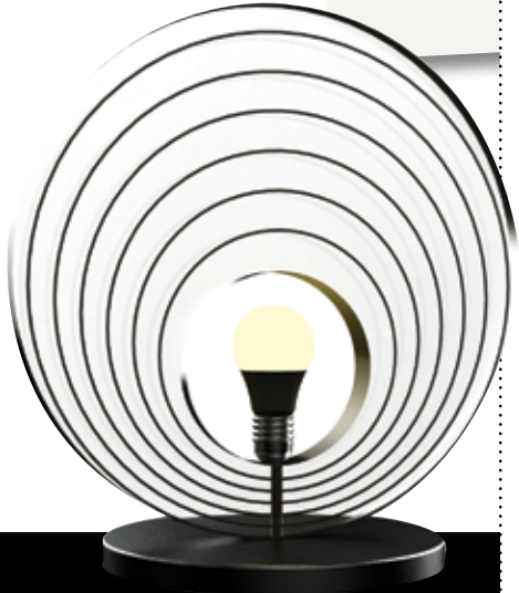
Daire formu ile dikkat çeken Drop, masa lambası ve puf'ya da sehpa olarak kullanılabilen çok amaçlı bir tamamlayıcı olan Round, birbirinden bağımsız hikâyelerden doğan özgün tasarımlar.