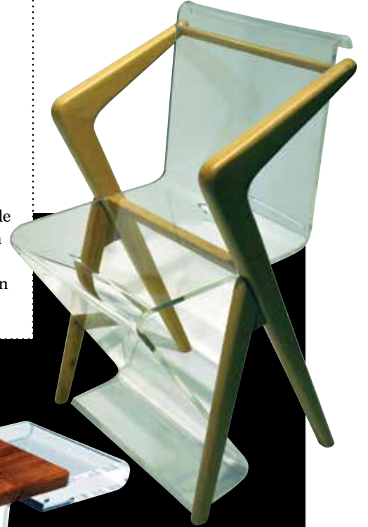
Boomerang sandalye 2016 Milano A' Design Award ödülü sahibi. Şeffaf taşıyıcı strüktürü ile zeminden koparılan Wait bank ise hem sehpa hem de dergilik işlevi görüyor.