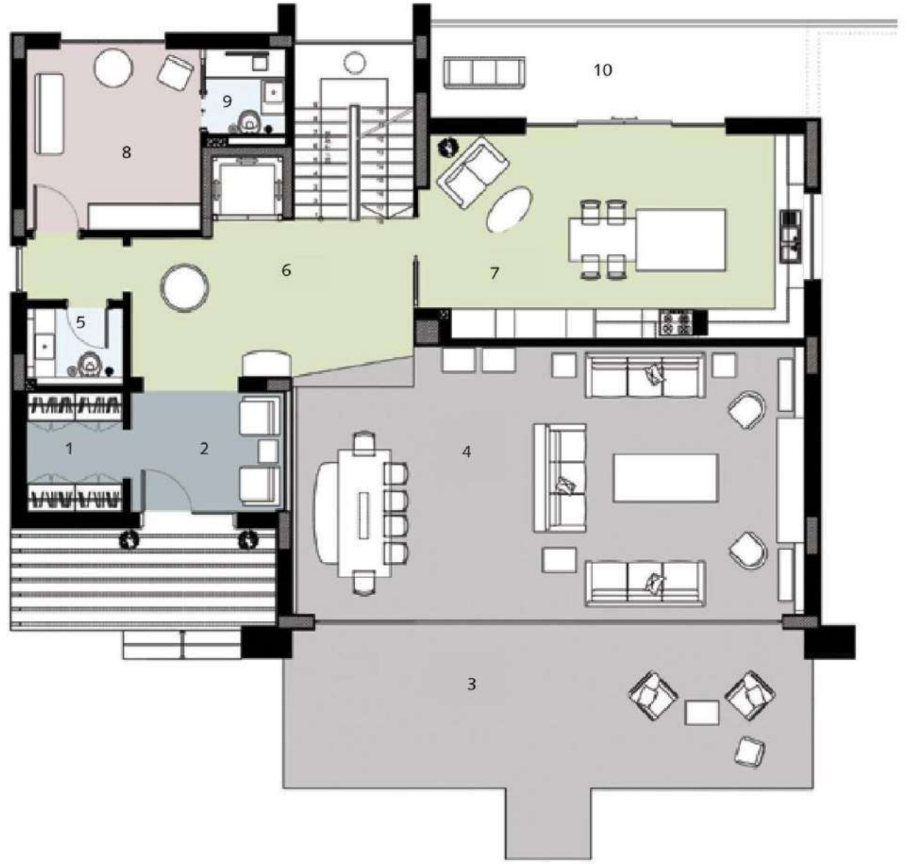
Zemin Katı Planı / Ground Floor Plan